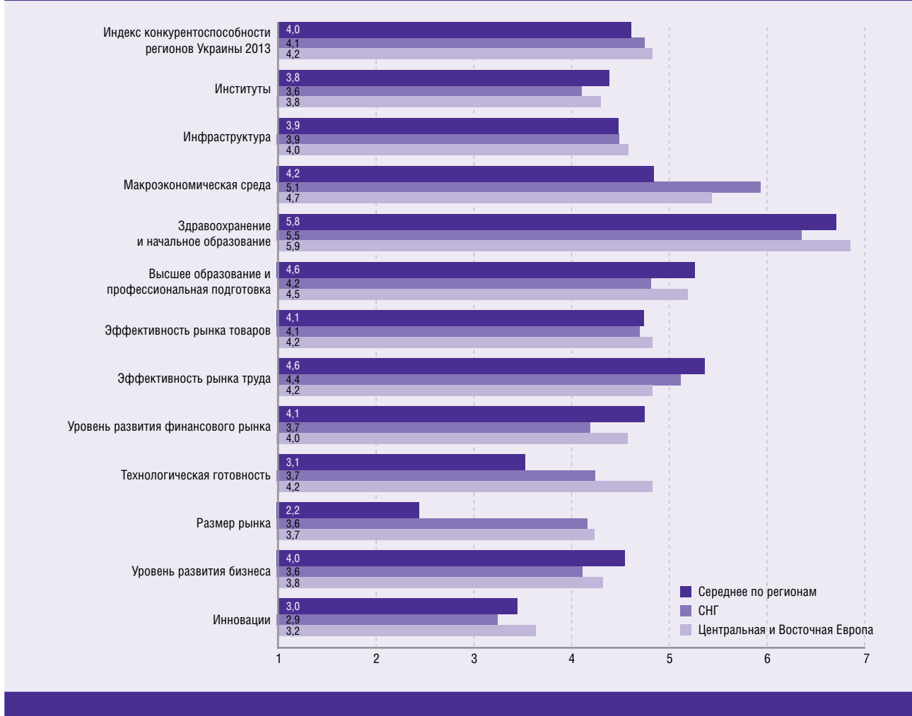
Рисунок 2.2 Средние оценки регионов Украины в 2013 году в сравнении со странами ЦВЕ и СНГ